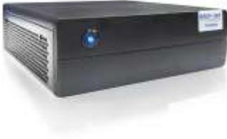
Penetrator S7 SFF (Arka taraf): Port A LAN (Sağ Taraf)

Penetrator S7 SFF Ağ Portları arka tarafında bulunmaktadır.